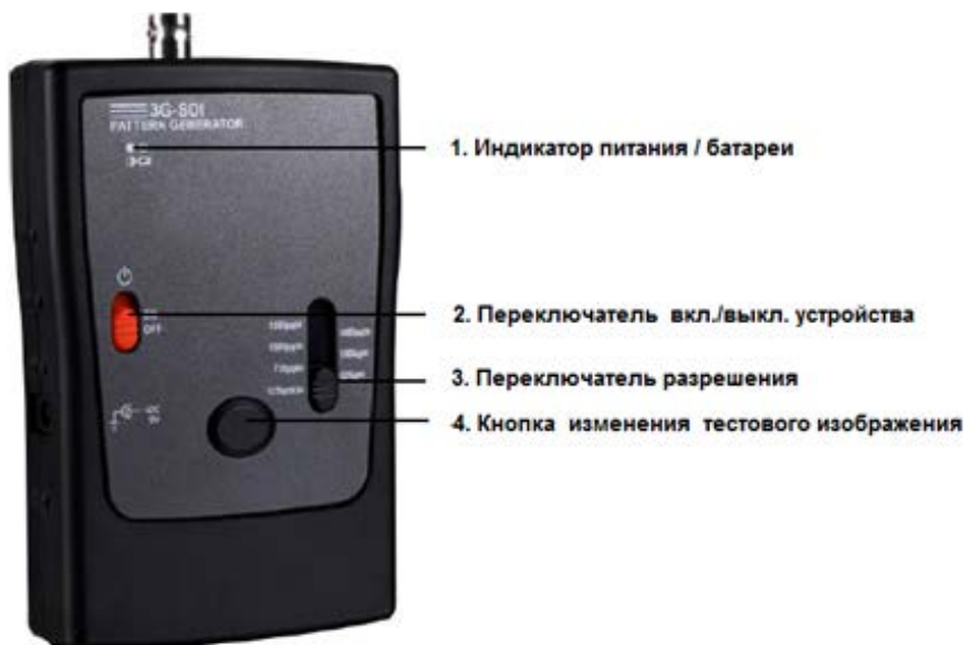
Рис. 1 Лицевая панель G-SDI/3