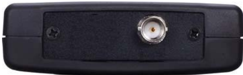
Рис. 2 Вид сверху G-SDI/3