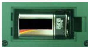
Рис. 3 Разъём для подключения щелочной батареи.