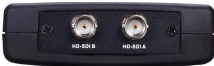
Рис. 2 Вид сверху G-SDI/4