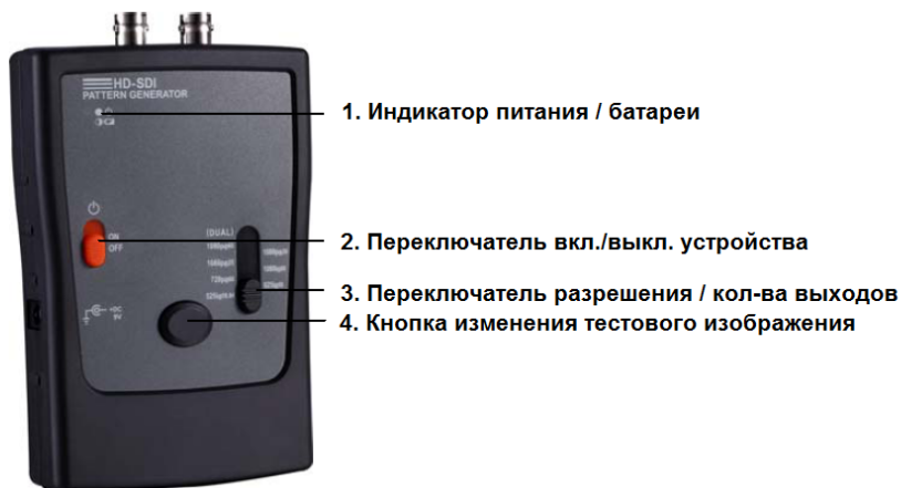
Рис. 1 Лицевая панель G-SDI/4