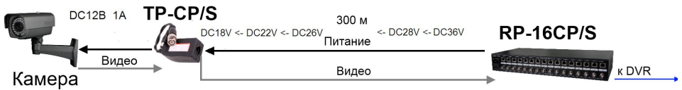
Рис. 4 Схема подключения TP-CP/S к RP-4CP/S, RP-8CP/S, RP-16CP/S