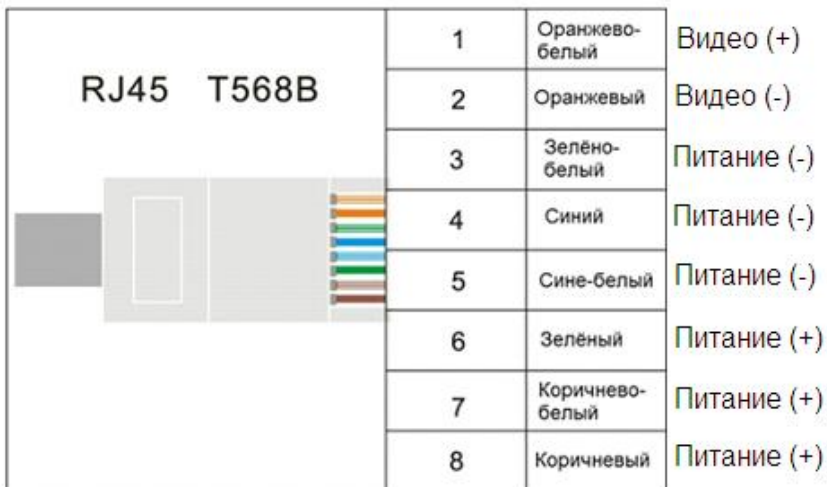
Рис.5 Распиновка разъемов RJ45