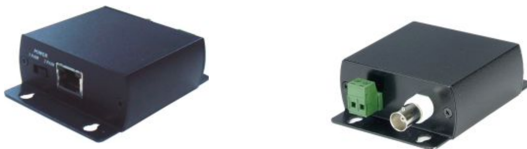
Рис.1 Внешний вид