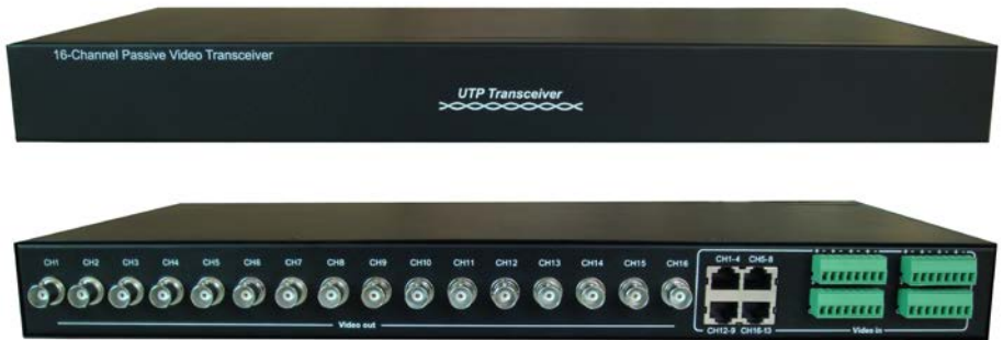
Рис.1 Внешний вид TP-C16