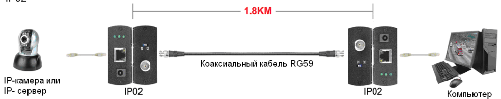
Рис. 3 Схема подключения IP02