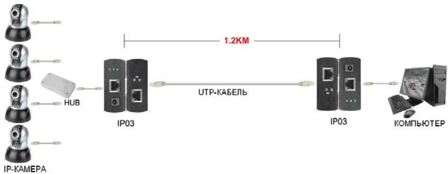
Рис. 5 Схема подключения к нескольким IP-камерам