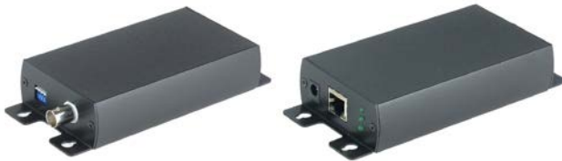
Рис. 1 Внешний вид IP02