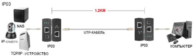
Рис.4 Схема подключения IP03