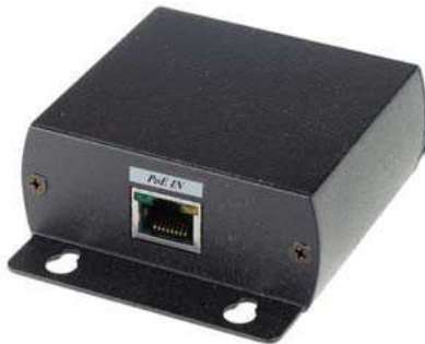
Рис. 1 Внешний вид устройства IP04