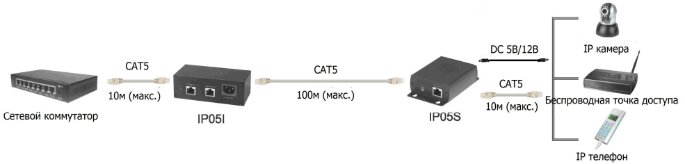
Рис.2 Схема подключения инжектора IP05I и сплиттера IP05S.