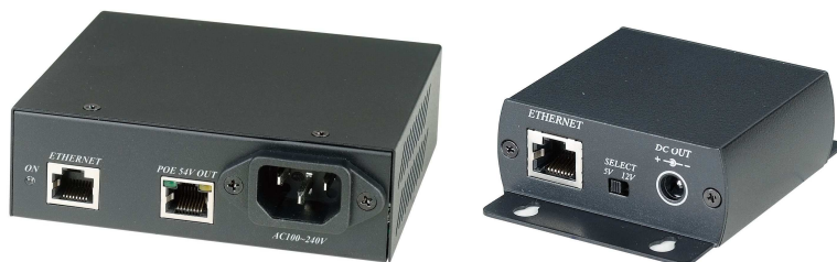
Рис.1 Внешний вид инжектора IP05I и сплиттера IP05S.