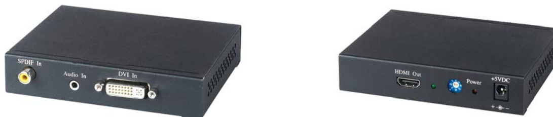
Рис.1 Внешний вид DH01