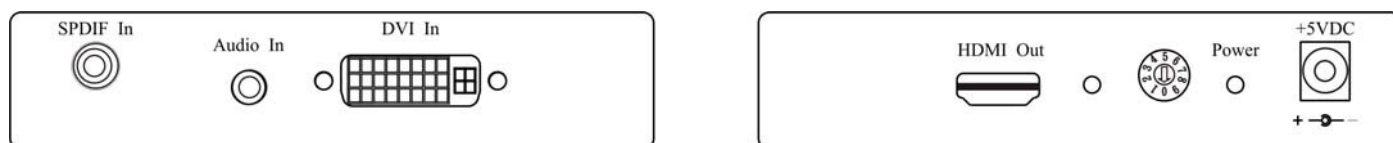
Рис.3 Панель подключения DH01