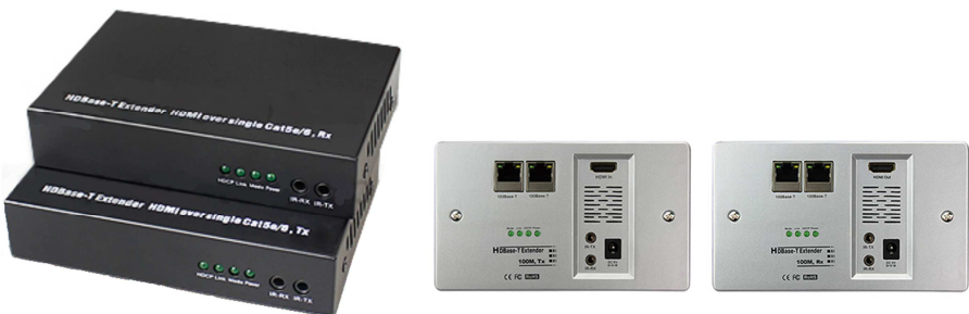
Рис. 1 TA-Hi/BT+RA-Hi/BT комплект передатчик + приёмник, его настенное исполнение TA-Hi/BT(W)+RA-Hi/BT(W)