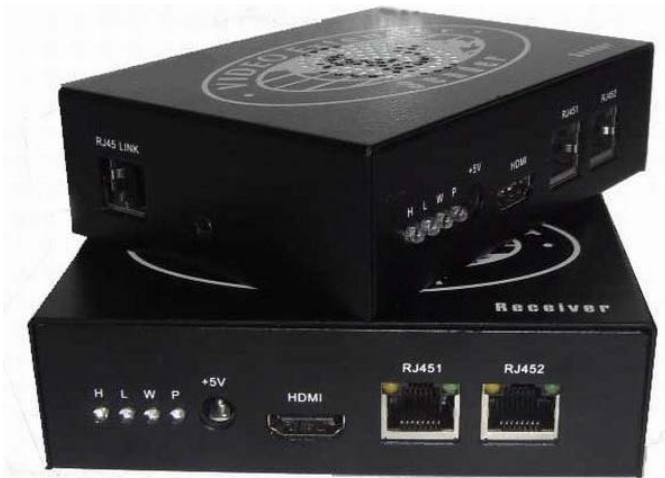
Рис.2 Внешний вид передатчика TA-IPHi и приемника RA-IPHi