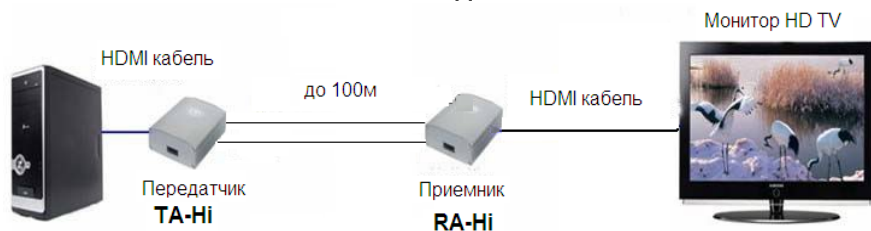
Рис.3 Схема подключения передатчика TA-Hi и приемника RA-Hi