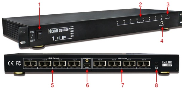
Рис.3 Элементы разветвителя D-Hi104T/D-Hi108T