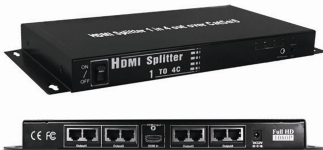
Рис.1 Разветвитель D-Hi104T