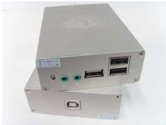
Рис.1 Внешний вид TA-U1/2+RA-U3/2