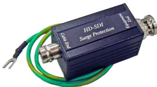
Рис. 1 Внешний вид устройства SP007.