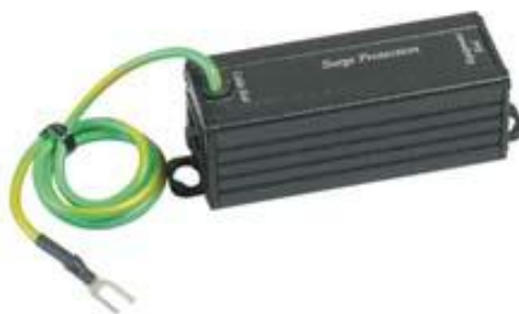
Рис.1 Внешний вид